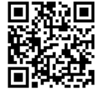
三原市認知症高齢者家族やすらぎ支援事業